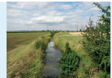
Gewässer mit Gewässerrandstreifen